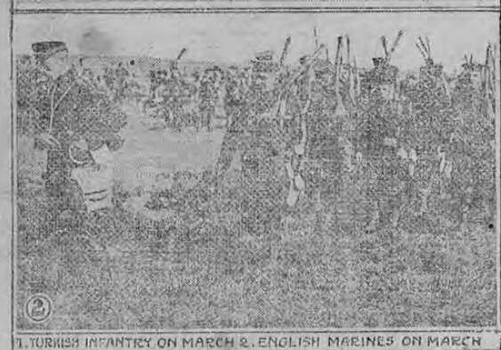
1. TURKISH INFANTRY ON MARCH 2. ENGLISH MARINES ON MARCH

Se informa que los turcos se apresuran a concentrar tropas en el lado asiático de los Dardanelos a fin de impedir que los aliados logren abrirse paso y llegar a capturar la ciudad de Constantinopla. Este ejército se está concentrando bajo las órdenes de Essed Bajá, el defensor de Janina. Si los barcos de guerra de los aliados desembarcan sus marinos es casi seguro que habrá un violento encuentro. El grabado superior muestra una sección de infantería turca en marcha mientras que la inferior muestra un cuerpo de marinos ingleses.