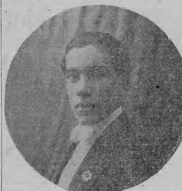
RAFAEL CARDONA J. HOMENAJE AL POETA (Reconstrucción de un "impronta" leido en el acto de la inhumación de los restos del poeta.)